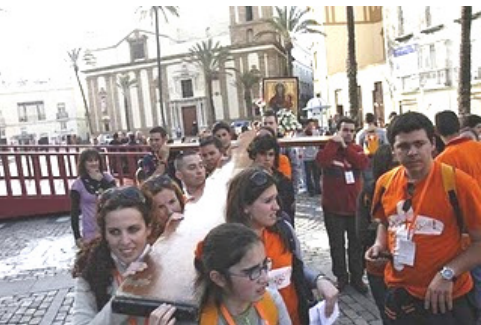
Via Crucis por la Vida, Cádiz